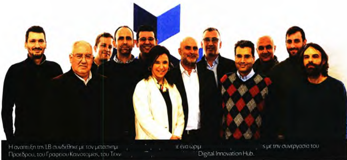
Η ονομασία της LB συνδέθηκε με τον μετασχηματισμό του Προέδρου, του Γραφείου Καινοτομίας, του Τεχνολογικού Κέντρου

Ποια είναι τα αποτελέσματα της εξυπνης πληροφόρησης LB; Ένα συνεχές B2B sales lead generation, το οποίο αλλάζει τους συσχετισμούς στο ελληνικό επιχειρηματικό τοπίο. Λένε ότι η πώληση σε νέους πελάτες κοστίζει τουλάχιστον πέντε φορές συγκρι-